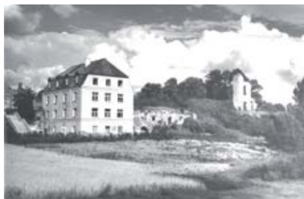
Zawieprzycy, fot. ze zbiorów Woj. B. Publ. w Lublinie, sygn. 1735III