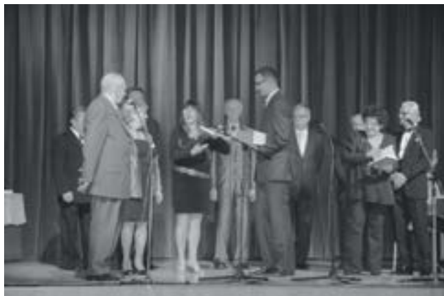
Wieczór autorsko- kabaretowy w Domu Kultury LSM