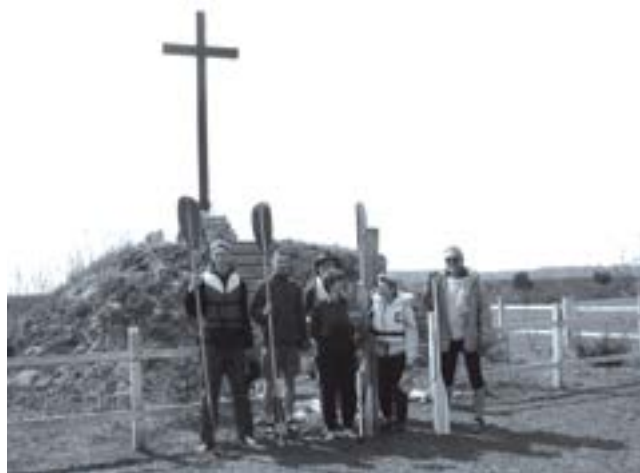
fot. Krzyż nad Prypecią

Na wołyńskim Polesiu znalazł się po raz pierwszy w maju 2004 r. Wtedy za sprawą rodziny mieszkającej we Włodzimierzu Wołyńskim poznał okolice Szacka, a szczególnie jeziora Piaseczno i wołyńską Świtąż. Oglądał tu wąski ciek wodny, który dawał początek legendarnej, bagienno-szuwarowej Prypeci (która swój początek ma na wysokości Włodawy, kilka kilometrów od granicznego Bugu). Być może już wtedy „Polesia czar” zawładnął jego wyobraźnią i zdecydował o podjęciu próby zmierzenia się z rzeką, która słusznie nazywana jest Amazonką Środkowo-Wschodniej Europy.