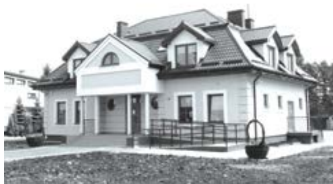
fort.Gminny Dom Kultury

Przez długi czas, kiedy mieszkańcy Cycowa i okolicy nie dysponowali placówką kulturalną, taką rolę pełnił Zespół Szkół w Cycowie, w którym odbywało się wiele imprez, obradował VII Sejmik Towarzystw Regionalnych Lubelszczyzny, utworzono także Izbę Tradycji i Izbę Regionalną.