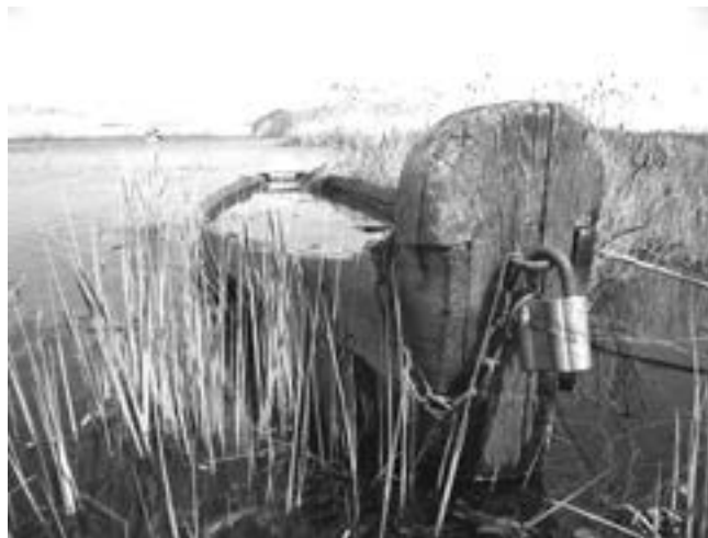
fol. Prypeć 2006

i ukraińskich. Po śmierci żony w 1999 r. pływał z trójką swoich dzieci na kanadyjce. Publikował reportaże z wypraw, m.in. w Magazynie Kajakowym „Wiosło”, kwartalniku „Znad Wili” oraz na stronach internetowych. Planując kolejne wyprawy, odszedł niespodziewanie 3 listopada 2006 r. W 2007 r. ukazała się jego książka pt. „Wodami Polski, Litwy i Ukrainy. Reportaże i wspomnienia” (Wydana przez Zw. Literatów Polskich w Lublinie).